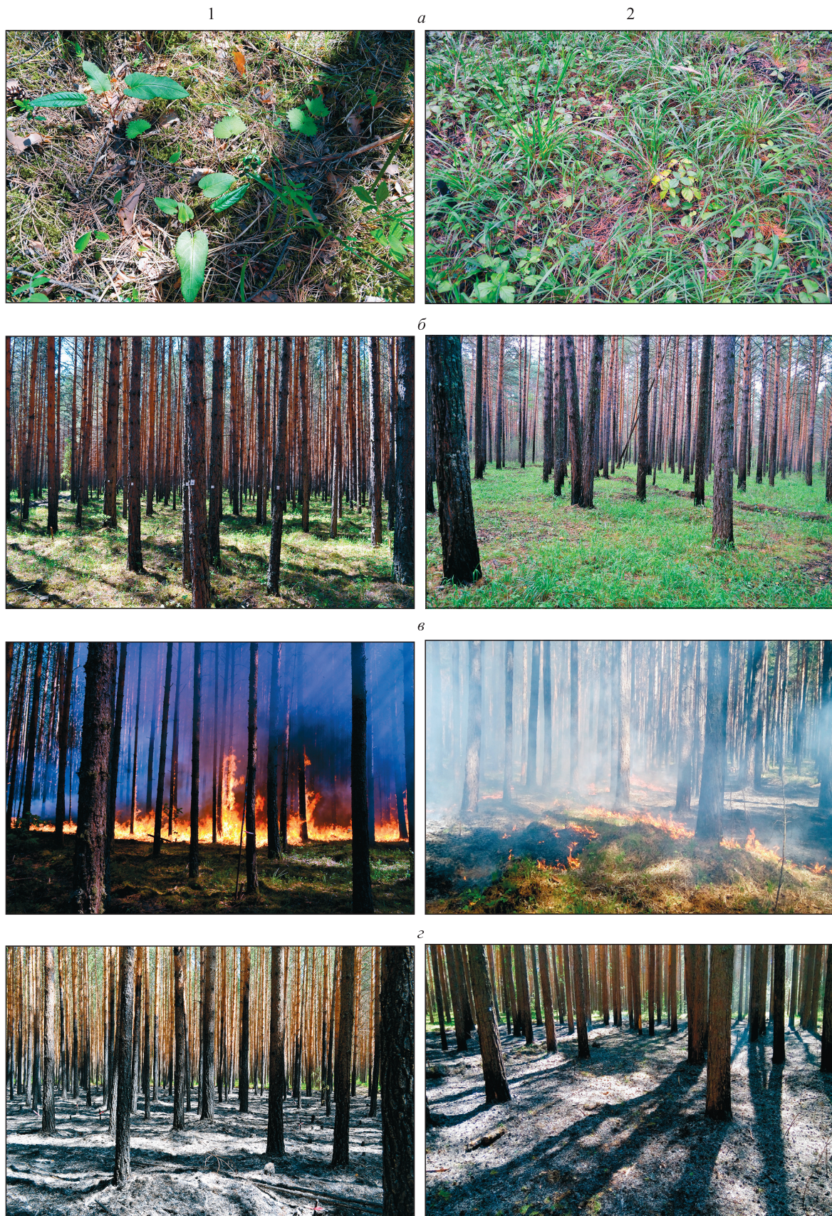
Рис. 1. Эксперименты по контролируемым выжиганиям на ПП. 1 – средневозрастной древостой; 2 – спелый древостой: а – живой напочвенный покров до пожара; б – древостои до пожара; в – экспериментальные выжигания; г – древостои и напочвенный покров после выжиганий.